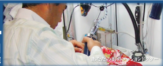
あなたの街のファッションドクター