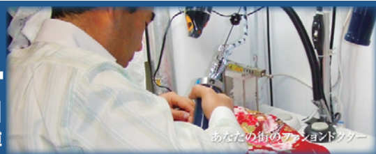
あなたの街のファッションドクター

能登半島豪雨災害、お亡くなりになられた方々に謹んでお悔やみを申し上げますとともに、被災されたみなさまに心よりお見舞い申し上げます。