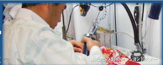
あなたの街のファッションリーダー