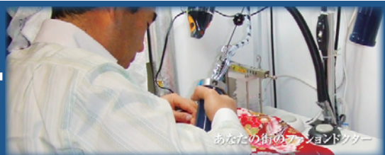
あなたの街のファッションドクター